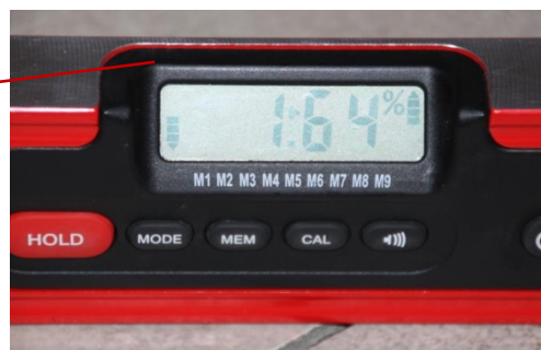
Figur1: Omregning fra % viser at flaten med 1,64 % helning tilsvarer fallforhold ca 1:60