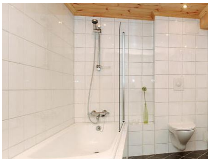
Figur 1: Flislagte vegger og golv gir fuktrobuste kjellerrom

Mange har kjellere eller underetasjer som de ønsker å pusse opp eller bygge om til oppholdsrom. Ofte er det støpte eller murte kjellere som er dårlig isolerte eller det kan være behov for og tett mot fuktinnsig. Grunnet mer ekstremvær og risiko for vannskader i kjellere er det viktig å ha fuktrobuste materialer som kan tørke ut framfor å måtte skiftes hvis oversvømmelse eller lekkasje skulle oppstå. I to artikler gis praktiske råd om hvordan flislegge kjellervegger. Denne artikkelen omhandler liming rett på eksisterende vegg.