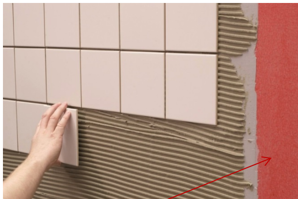
Figur 5: I de fleste tilfeller skal det brukes membran på vegger under terrengnivå.

Kjelleryttervegger kan betraktes som en kald yttervegg, både de områdene som ligger over og under terrengnivået. Skal rommet brukes som våtrom eller vaskerom benyttes en påstrykningsmembran som også fungerer som rommets dampsperrer. Membranen må da ha nødvendig damp tetthet (Vanddampmotstand med S_d -verdi på minimum 10 m)