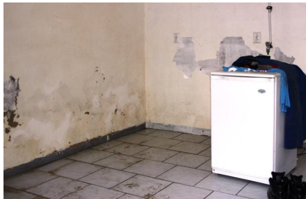
Figur 3: Løs puss er et symptom på fuktvandring i veggen som må tettes fra utsiden

Mange har fått kjellere nedfuktet av vann grunnet oversvømmelser, vannrør som har sprunget lekk mm. Er puss sprenget løs eller er det fuktige partier på veggen, må veggen utbedres og tørkes ut før den kan flislegges.