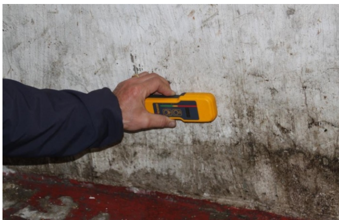
Figur 6: Fuktindikatoren registrerer raskt fuktforskjeller i underlaget.

Limes fliser rett på en fuktig mur kan det medføre at fukt, kalk og salter fortsatt transporteres via fugene ut på flisflaten. I verste fall kan salter sprengte løs gammel puss så pålimte fliser buler ut eller løsner.